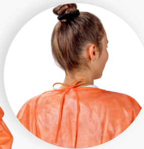
Rückseitiges Binden an Nacken und Taille