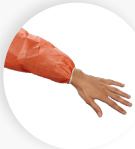
Gummibündchen am Ärmelabschluss