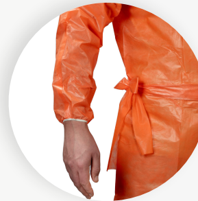
Seitliche Bindung des Taillengürtels