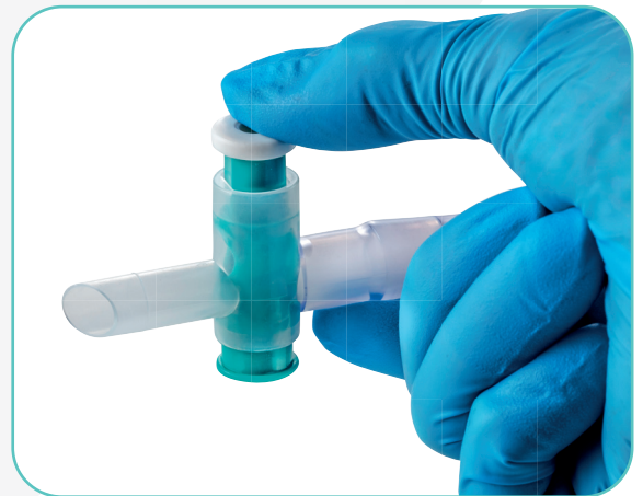
Urin-Ablass mit Kreuzventil für eine hygienische, komfortable Einhandbedienung