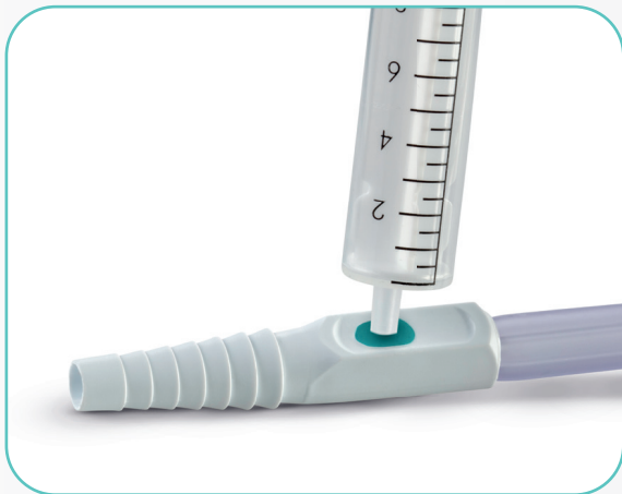
Konnektor mit nadelfreier Urinprobe-Entnahmestelle verhindert Stichverletzungen