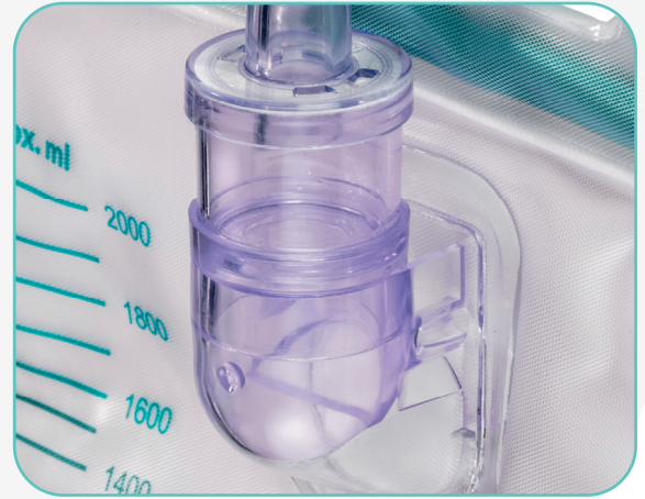
Tropfkammer mit integriertem Anti-Rückflussventil und hydrophob beschichtetem Mikrofilter