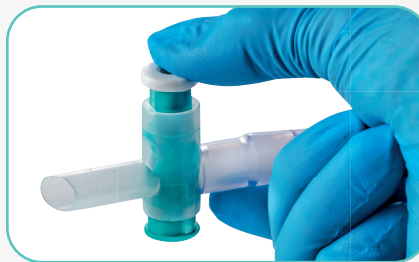
Urin-Ablass mit Kreuzventil für eine hygienische, komfortable Einhandbedienung