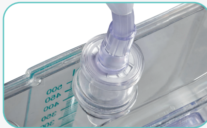
Tropfkammer mit integriertem Anti-Rückflussventil und hydrophob beschichtetem Mikrofilter