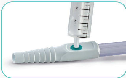
Konnektor mit nadelfreier Urinprobe-Entnahmestelle verhindert Stichverletzungen